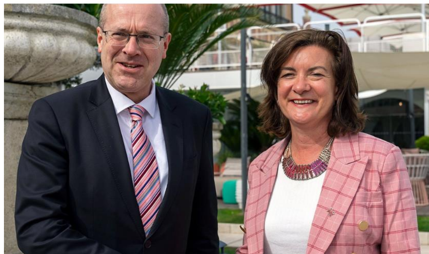
Penodi Eluned Morgan yn Hyrwyddwr Sefydliad Iechyd y Byd ar gyfer Menter Economi Llesiant Ewrop