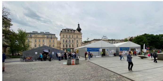
Temporary accommodation, kitchen and dining area, as well as clothes distribution point run by volunteers and charities in Krakow